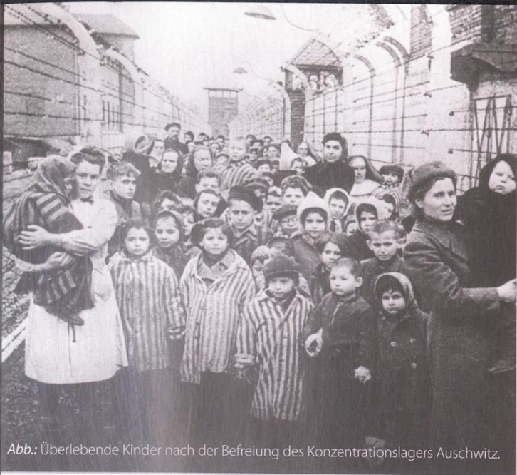
Abb.: Überlebende Kinder nach der Befreiung des Konzentrationslagers Auschwitz.

1945 wurde ich zum Maskottchen der ersten Polnischen Kosciuszko-Division und nahm mit ihr, sozusagen, an der Schlacht um Berlin teil. Nach Rückkehr der Kosciuszko-Division nach Polen kam ich in ein jüdisches Waisenhaus in der Nähe von Warschau.