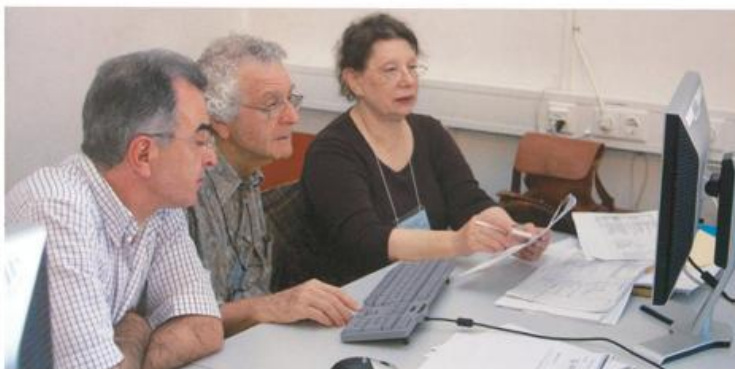
Abb. rechts: 1.300 Besucher aus 24 Ländern zählte der ITS im ersten Jahr nach Öffnung des Archivs.

Abb. oben: Knapp 80.000 User nutzten 2008 das Online-Angebot des ITS.