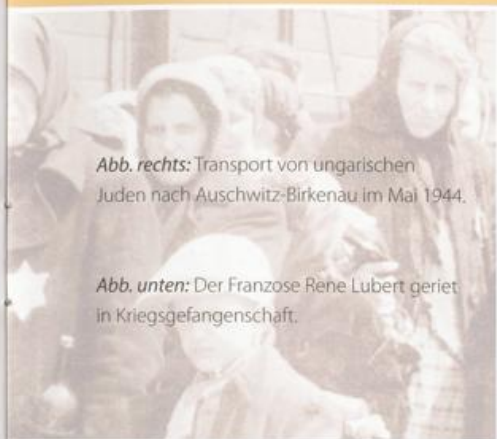
Abb. rechts: Transport von ungarischen Juden nach Auschwitz-Birkenau im Mai 1944.