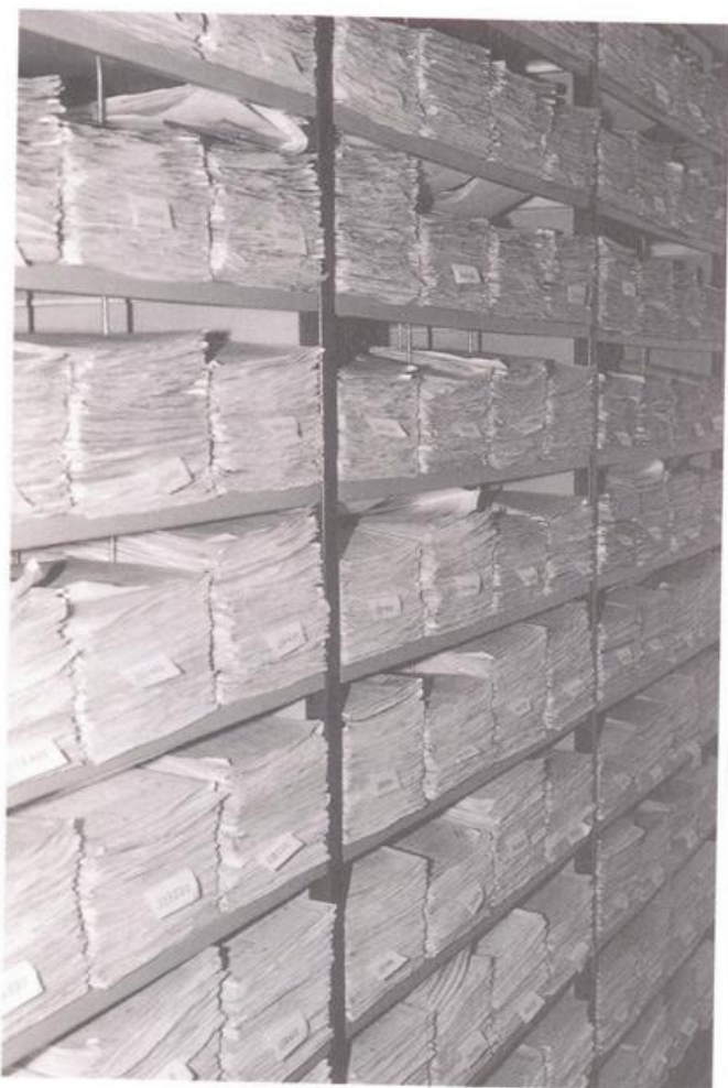
Endablage bearbeiteter Vorgänge