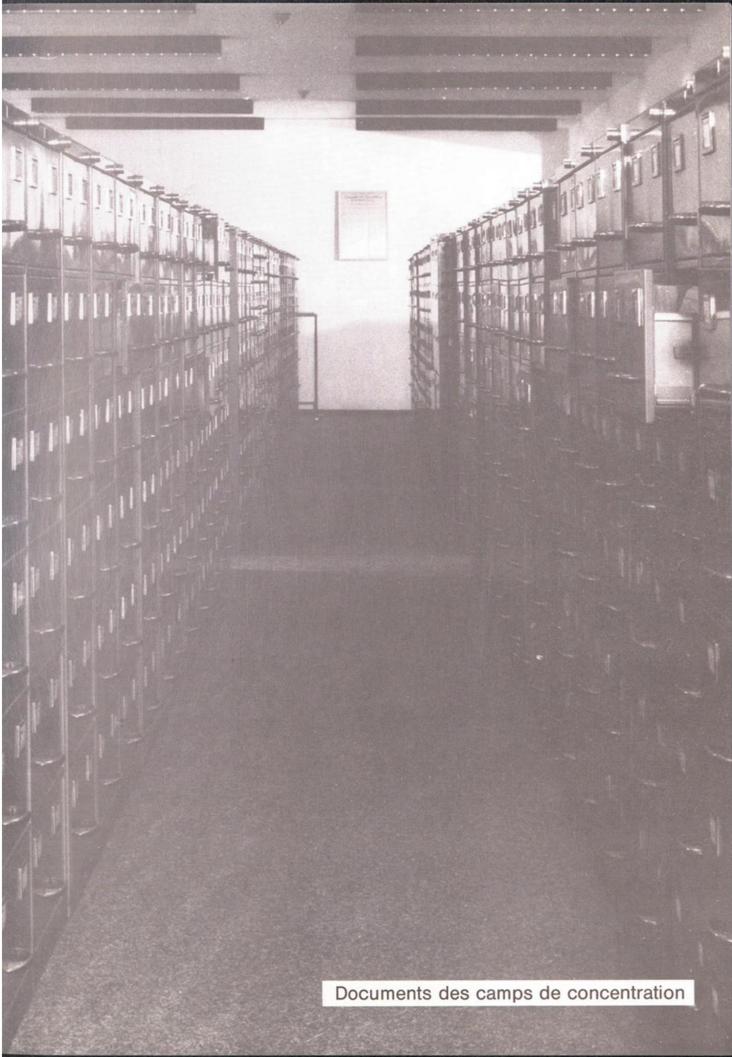
Documents des camps de concentration