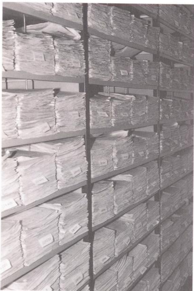
Dépôt final des dossiers traités