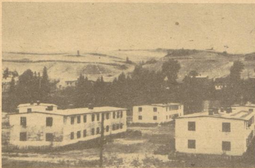
Obóz w Landeshut - widok ogólny. Na pierwszym planie od lewej bloki II i I na drugim planie dach bloku V oraz blok IV i III..

Francuzi pozostawili po sobie pamiątki na ścianach wewnętrznych bloków w postaci rysunków opatrzonych napisami w ich języku.