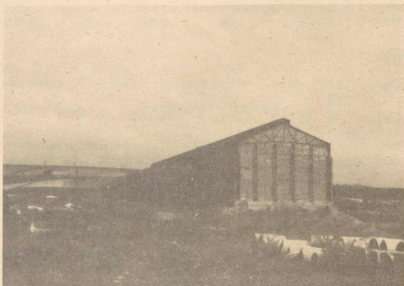
Landeshut Werk III widok ogólny miejsce kaźni karnej kompanii Nr arch. Gross-Rosen 3.2.1.5

dźwigania tak wielkich ciężarów. Próbujemy więc toczyć podwozia kołami po rozmokłej ziemi. Hoch! hoch! wrzeszczą na taki widok SS-mani i funkcyjni i biją kijami w zgięte od wysiłku karki. Staramy się więc ponownie dźwignąć na barki ten ciężar ponad siły.