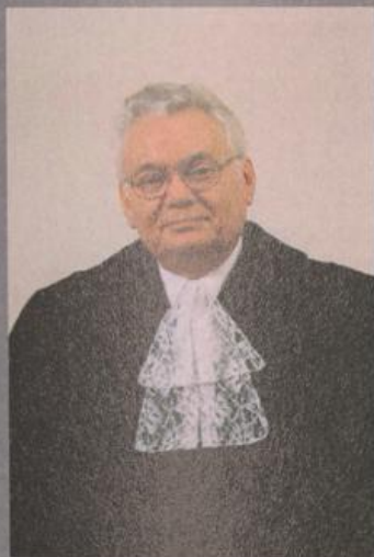
Thomas Buergenthal als Richter am Internationalen Strafgerichtshof, Den Haag, um 2003

Die Verfolgung durch die Nationalsozialisten und die dramatische Suche nach 1945 hielt Thomas Buergenthal in seiner Autobiografie fest: Ein Glückskind. Wie ein kleiner Junge zwei Ghettos, Auschwitz und den Todesmarsch überlebte und ein neues Leben fand.