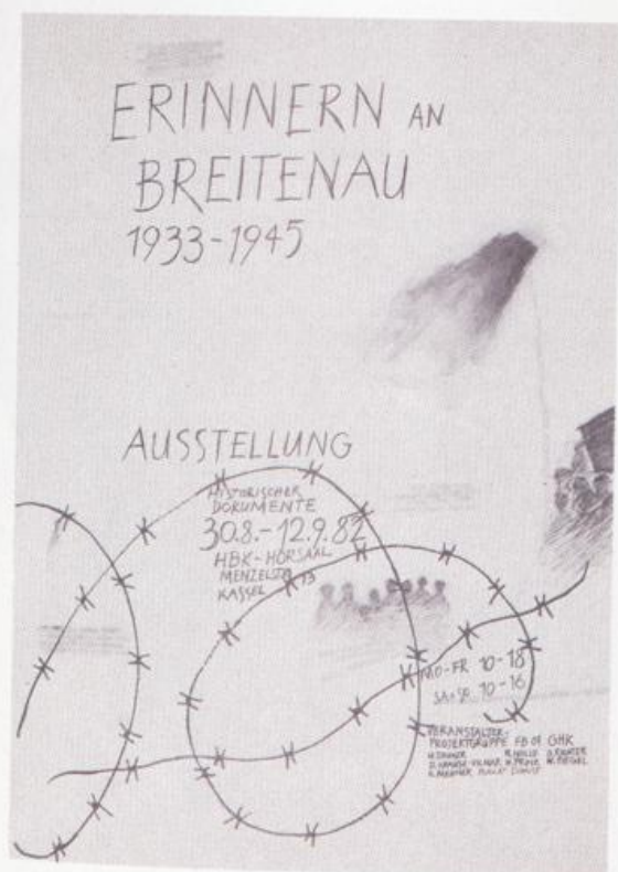
Flyer for the Exhibition Remembering Breitenau 1933-1945, August 30 to September 12, 1982

From the early 1980s, local memorial initiatives campaigned for the remembrance and investigation of the early concentration and labor education camp of Breitenau. "Dig where you stand" was the motto of many initiatives throughout Germany, which dealt locally with buried Nazi history and stood in solidarity with unrecognized victims of the Nazis.