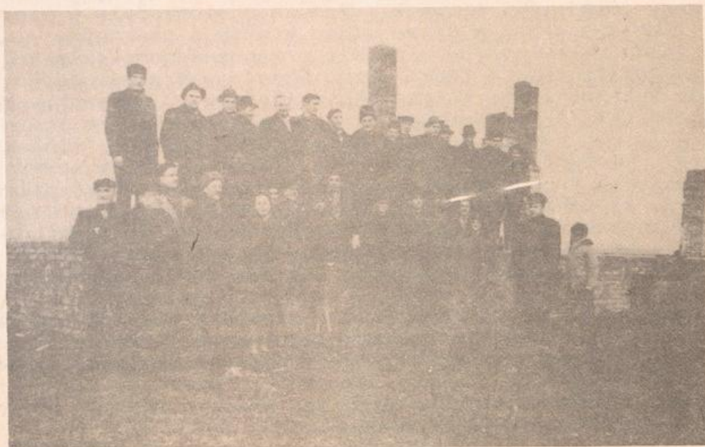
Obóz "Fünfteichen" w 1965 roku; oglądała go grupa b. więźniów Nr archiwum Gross-Rosen 3.3.1.2