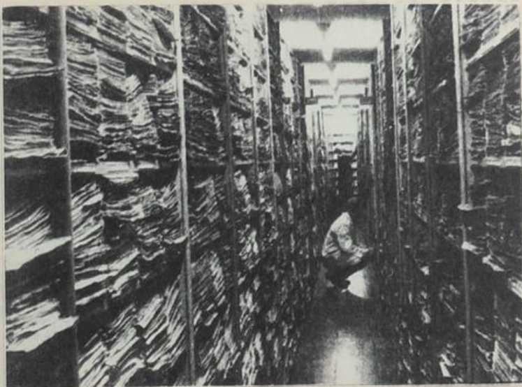
In den Regalen des Internationalen Suchdienstes häufen sich die Unterlagen über zahllose Opfer der nationalsozialistischen Gewaltherrschaft.

Der Internationale Suchdienst begeht in diesen Tagen seinen 20. Jahrestag