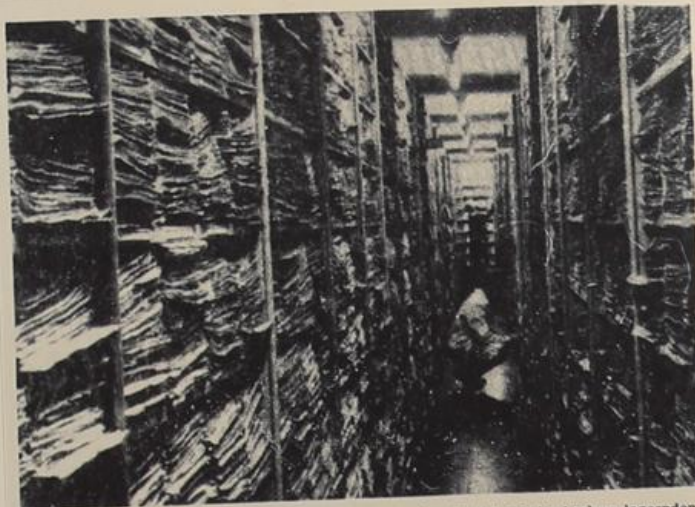
Einen Eindruck von der Fülle der beim Internationalen Suchdienst in Arolsen lagernden Dokumente vermittelt unser AP-Bild, das einen Blick in die Ablage freigibt.