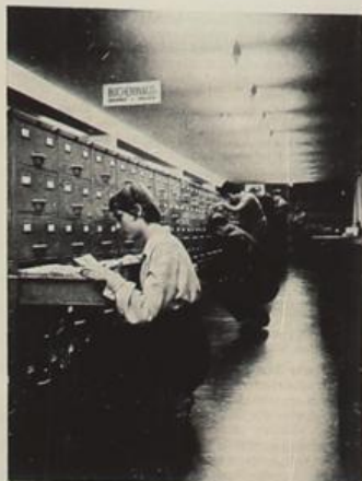
In riesigen Archiven werden die Dokumente und Aufzeichnungen griffbereit geordnet aufbewahrt. Unser Bild zeigt einen Ausschnitt aus der Abteilung „KZ Buchenwald“.