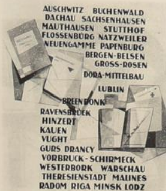
Ordnungsmäßig — belastet mit düsteren Erinnerungen an der jüngsten Vergangenheit. Eine der symbolischen Darstellungen in der Halle des ISD.