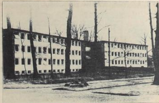
Erstes Gebäude im modernen Stil war der Neubau für den internationalen Suchdienst in Arolsen, der bis 1952 in der jetzigen belgischen Kaserne sein Domizil hatte. Seit der Errichtung des dreiflügeligen Bauwerks wurden hier weit über 1,5 Millionen Such- und Aufklärungsanträge aus aller Welt bearbeitet.