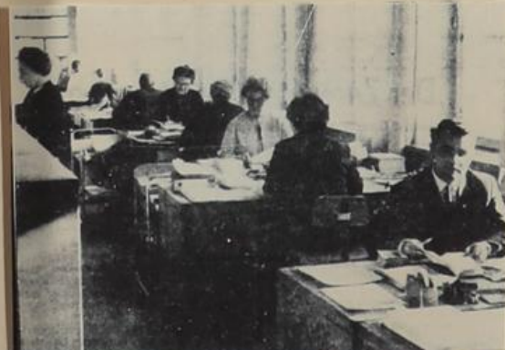
Mehr als 200 Mitarbeiter beschäftigt der Internationale Suchdienst in Arolsen, der seit der Souveränität der Bundesrepublik dem Internationalen Roten Kreuz untersteht. Ein Großteil der Angestellten beherrscht mehrere Fremdsprachen, vor allem slawische, um die aus allen Ländern Europas und vielen Überseeeländern eingehenden Anträge bearbeiten zu können. Unser Bild zeigt einen Blick in einen der modernen Arbeitsräume. (vg/Aufnahme: yg)