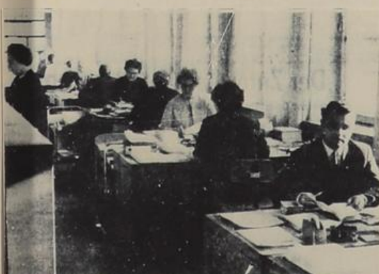
Mehr als 200 Mitarbeiter beschäftigt der Internationale Suchdienst in Arolsen, der seit der Souveränität der Bundesrepublik dem Internationalen Roten Kreuz untersteht. Ein Großteil der Angestellten beherrscht mehrere Fremdsprachen, vor allem slawische, um die aus allen Ländern Europas und vielen Überseeländern eingehenden Anträge bearbeiten zu können. Unser Bild zeigt einen Blick in einen der modernen Arbeitsräume. (vg/Aufnahme: vg)