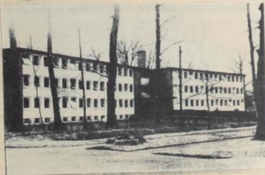
Erstes Gebäude im modernen Stil war der Neubau für den Internationalen Suchdienst in Arolsen, der bis 1952 in der jetzigen belgischen Kasernen sein Domizil hatte. Seit der Errichtung des dreiflügeligen Bauwerks wurden hier weit über 1,5 Millionen Such- und Aufklärungsanträge aus aller Welt bearbeitet.

„Unser Wunsch ist es“, heißt es in der Publikation zum 20jährigen Bestehen des Internationalen Suchdienstes, daß die häufig komplizierte und undankbare Aufgabe, die Bearbeitung der Aufzeichnungen, 30 Unterlagen, schwergeprüften Männern und Frauen ein wenig Entschädigung und Trost bringen möge.“ In diesem Sinne soll beim ISD in Arolsen weitergearbeitet werden, denn bei zur Aufklärung des letzten Vermißtenschicksals werden, leider, noch viele Jahre ins Land gehen.